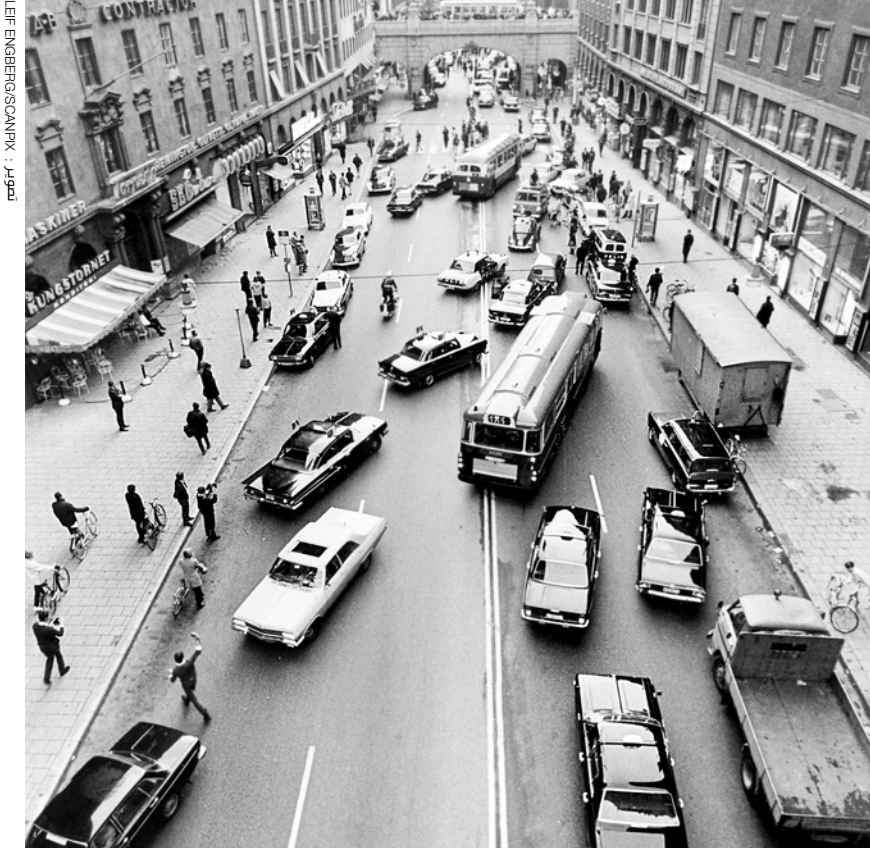
في 3 ايلول (سبتمبر) 1967 غيّرت السويد قانون السير على الطرقات من القيادة في الجانب الايسر الى القيادة في الجانب الايمن.