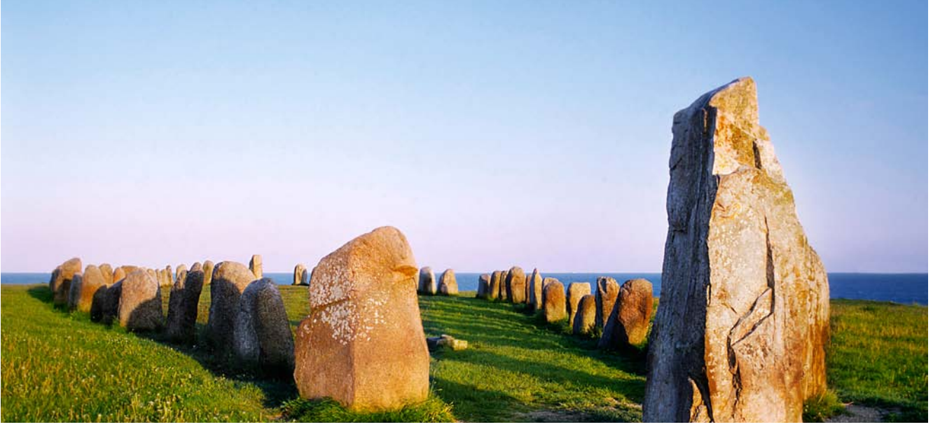
حجر اليه Aie في أوسترلين على الساحل الجنوبي في السويد. أقيم هذا النصب التذكاري عند القرن السادس الميلادي.