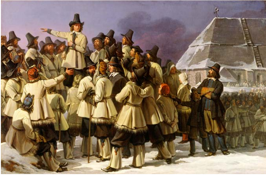
على جدار الكنيسة في مورا سنة 1520 حث غوستاف فاسا سكان البلد ان يحملوا السلاح ويساهموا في تحرير السويد من الاحتلال الدانماركي.

حكم بين الأعوام 1771 و 1792 ويُعدى عادة ملك المسرح. كان راعياً للفنون، وقد أسس أول دار أوبرا في ستوكهولم سنة 1782، والإكاديمية السويدية والإكاديمية الملكية السويدية للموسيقى. لكنه لم يحظ بمساعدة الطبقة الأرستقراطية العليا. وقد بلغت المعارضة ذروتها في مؤامرة نفذت سنة 1792 حين أُطلق عليه الرصاص في حفلة تنكرية أقيمت في دار الأوبرا. ومات يُعيد ذلك.