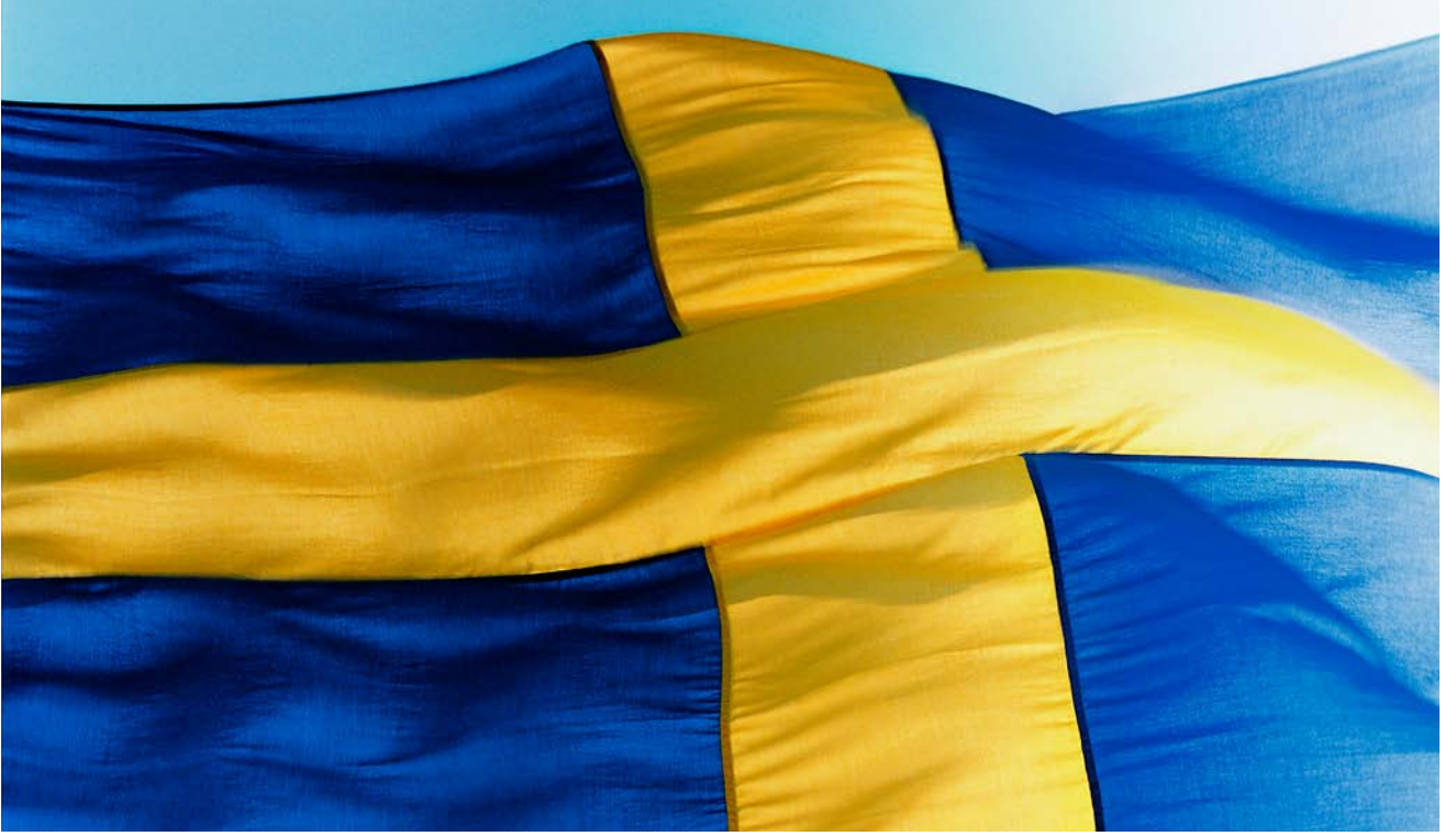
العلم السويدي ذو الصليب الأصفر على خلفية زرقاء، يعود تاريخه على الأقل إلى القرن السادس عشر.